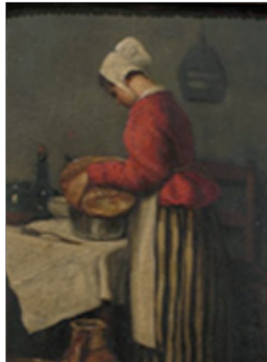
François Bonvin La tailleuse de soupe 1895