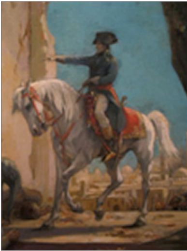
Bonaparte à la Mosquée du Caire 1872-1904