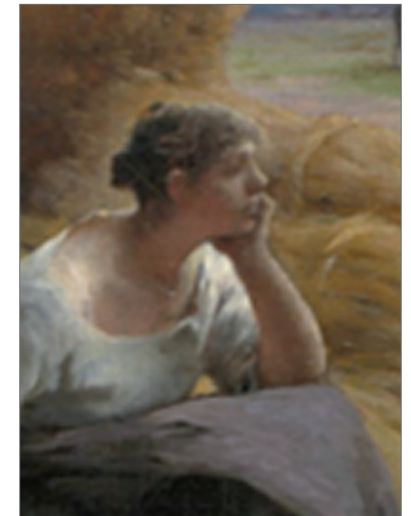
Henry Lerolle Les moissonneuses 1910