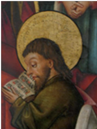
Maître de Rheinfelden La dormition de la Vierge 1460