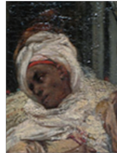
Georges Clairin Mosquée 1876