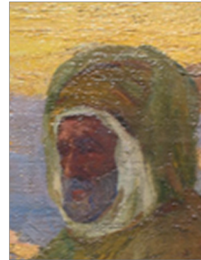
Anonyme sous les oliviers 1867-1936