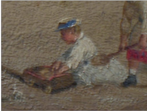
H. Renard Marine, place de Trouville 19ème siècle, huile sur panneau

Rechercher les enfants dans les tableaux et noter le nom de l'artiste, le titre du tableau, l'année de création et la technique.