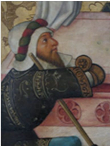
Garde assistant à la Résurrection du Christ 1460