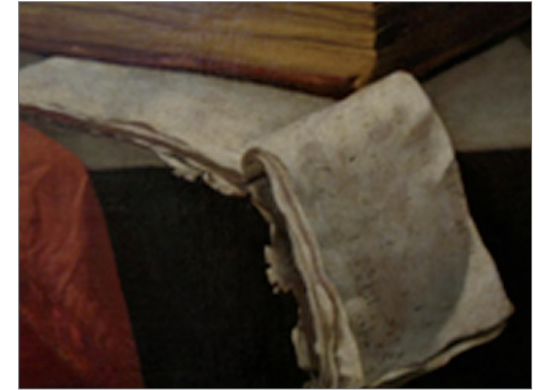
Des partitions de musique La création