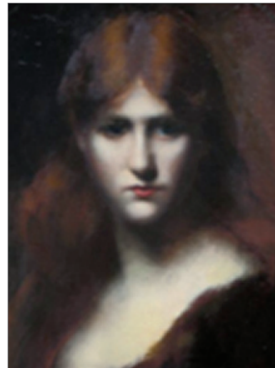
Lola de Jean-Jacques Henner 1829-1905