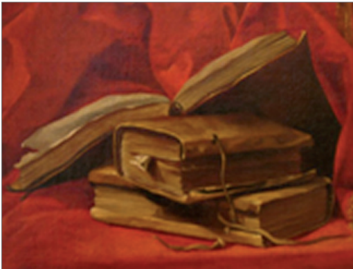
Des livres La connaissance