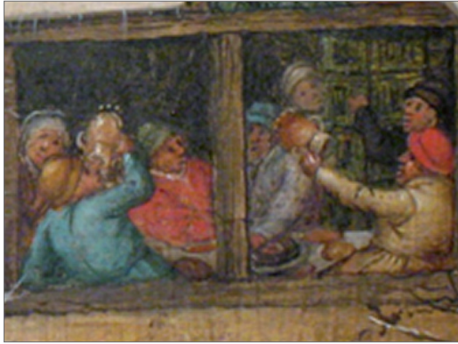
Pierre Brueghel (dit Brueghel le Jeune) Auberge près d'une scène de patinage 1613

Rechercher les lieux et les époques représentés.