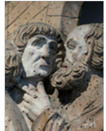
Deux apôtres près du Christ et de Thomas 16ème siècle