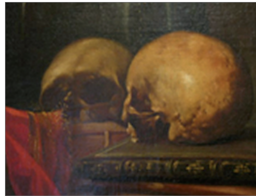
Un crâne La mort