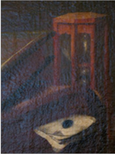
Un sablier Le temps