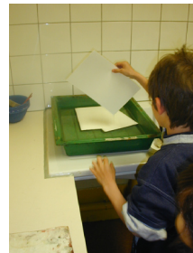
3. mouiller la feuille