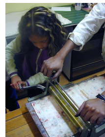
7. tourner la manivelle pour que le rouleau presse la feuille sur la plaque