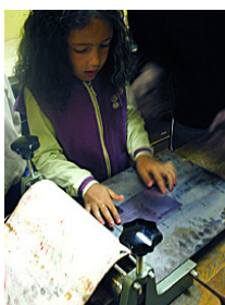
5. poser la plaque sur le plateau de la presse