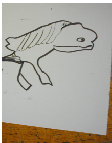
1. réaliser le dessin préparatoire sur une feuille de même format