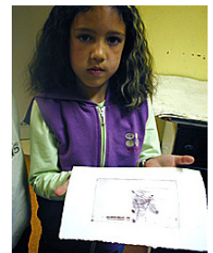
8. sécher la feuille et la disposer sous un poids pendant 24 h minimum