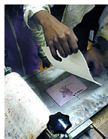
6. poser la feuille égouttée