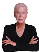
portrait de 3/4