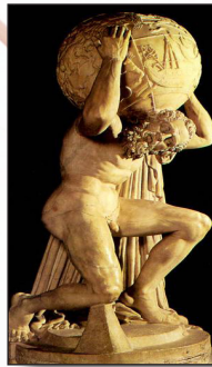
Atlas copie romaine d'une statue grecque

Il n'y a plus de fond, la sculpture est totalement libre du bloc de pierre. On peut faire le tour de l'œuvre.