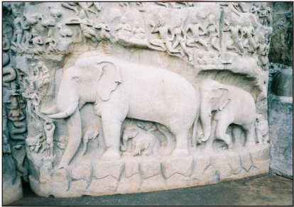
détail du temple mahabalipuram, Inde.