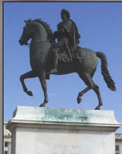
Statue Louis le Grand, Lyon

Les sculptures traditionnelles reposaient toujours sur un socle. C'est au XX ème siècle que les artistes ont commencé à le supprimer.