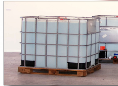
Mandla Reuter, Fountain