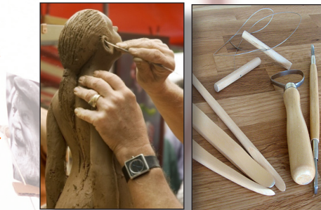
Mirettes et ébauchoir

A savoir 200 après JC, les artistes japonais fabriquaient des figurines en argile appelées Haniwa qu'ils plaçaient sur les tombes.