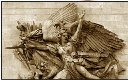
François Rude, La Marseillaise

On ne peut pas encore tourner complètement autour.