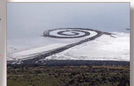
Robert Smithson, la jetée en spirale

A savoir Les premiers artistes du Land Art souhaitaient sortir du système commercial des galeries en réalisant des œuvres éphémères et difficilement vendables.