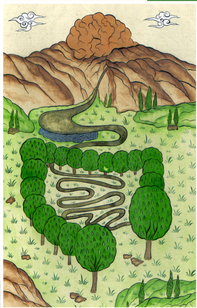
Enluminure ottomane, Manuel de médecine, XVII-XIXe siècle (?).