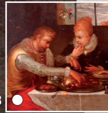
Le goût, Francken Franz II, Huile sur cuivre