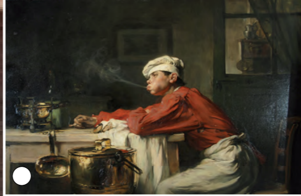
Farniente, Joseph Bail, Huile sur toile