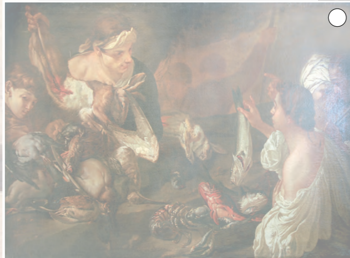
Scène du marché, Giuseppe Fardella, Huile sur toile

Mets-toi devant ce tableau «Scène de marché» et trace les lignes de composition du tableau ci-dessous.