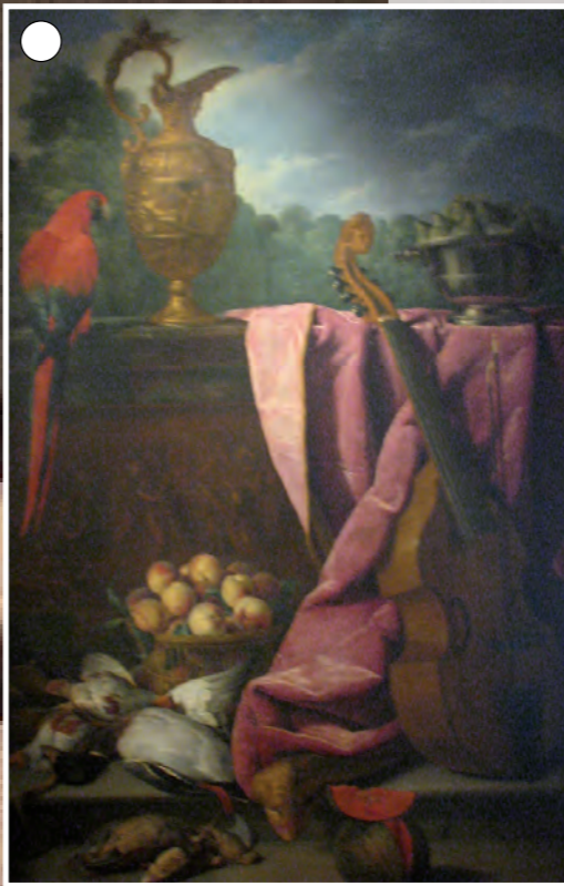
Nature morte, Alexandre-François Desportes, Huile sur toile