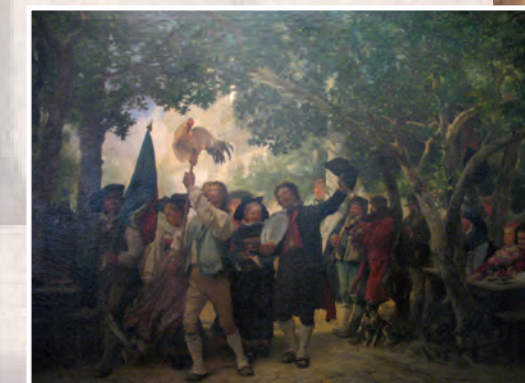
La Danse du coq, Gustave Brion, Huile sur toile

Cherche ce tableau dans la collection du Musée des Beaux-Arts. Assieds toi en face et regarde-le bien.