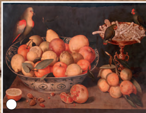
Nature morte, Peter Binoit, Huile sur cuivre