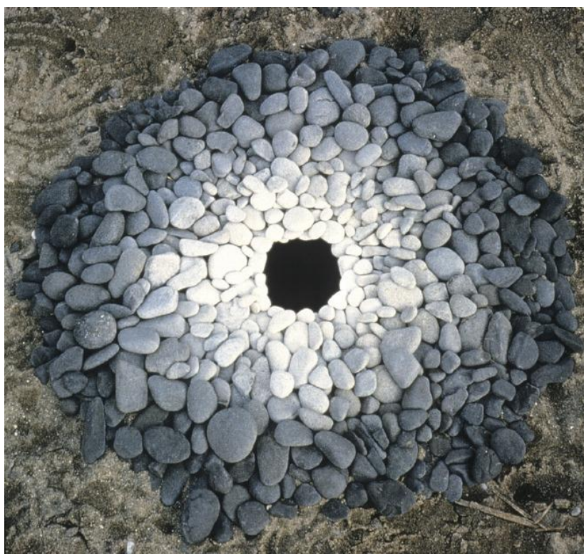
Photographie d'une installation, Andy Goldsworthy