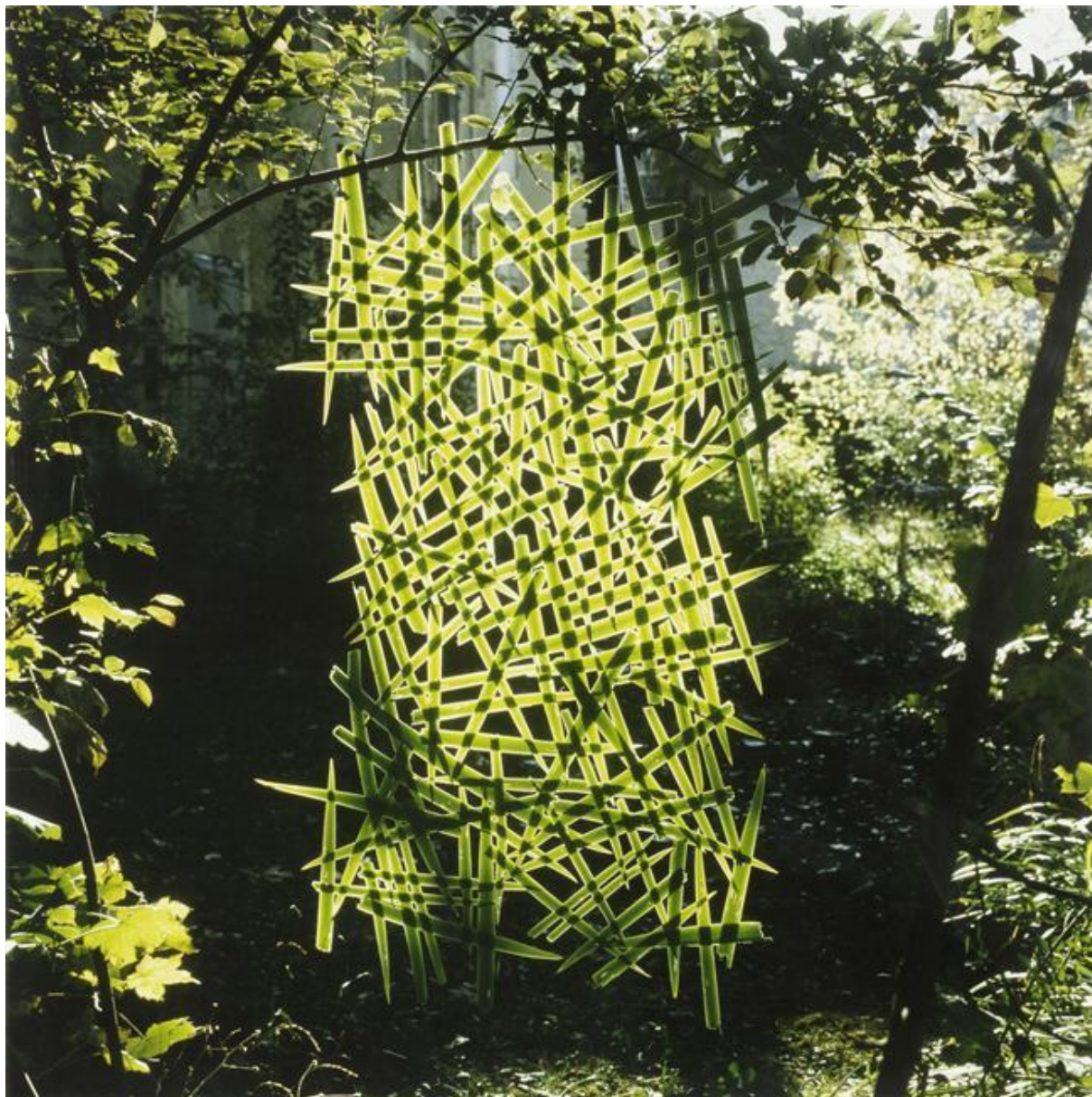
Iris avec des épines , photographie d'une installation, Andy Goldsworthy

https://www.photo.rmn.fr/CS.aspx?VP3=SearchResult&VBID=2CMFCIX2L9MW0&SMLS=1&RW=1366&RH=626