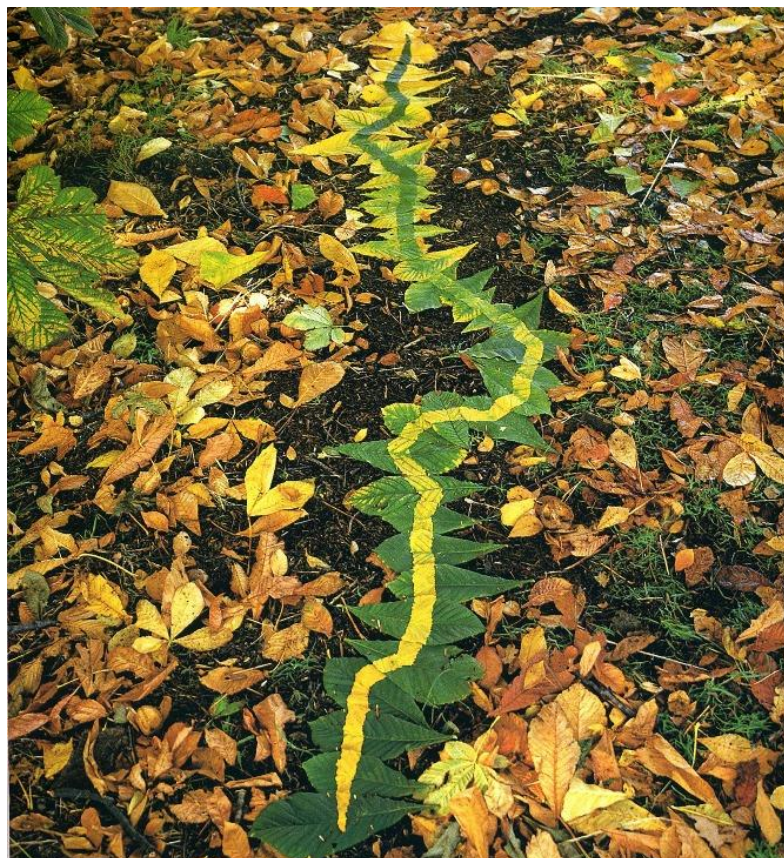
Photographie d'une installation, Andy Goldsworthy