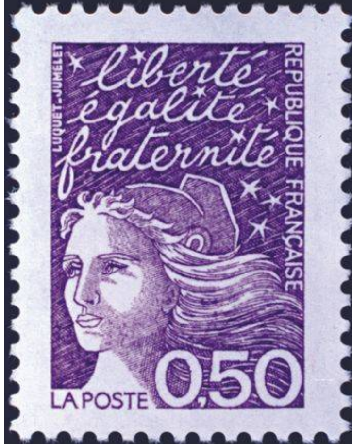
Liberté, égalité, fraternité, 1997