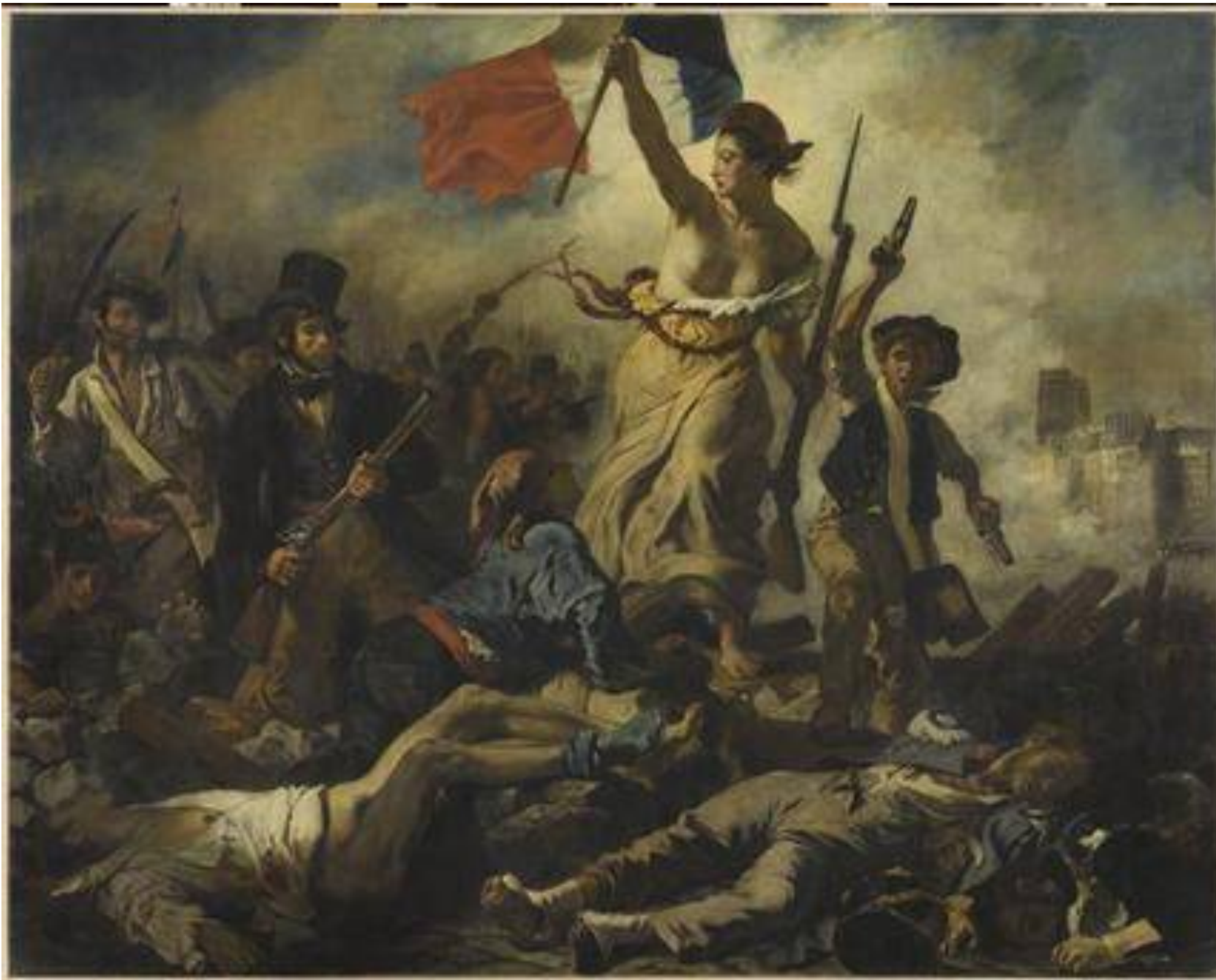
Le 28 juillet 1830 : La Liberté guidant le peuple, Eugène Delacroix, 1830, Huile sur toile, 2,6 m x 3,25 m.