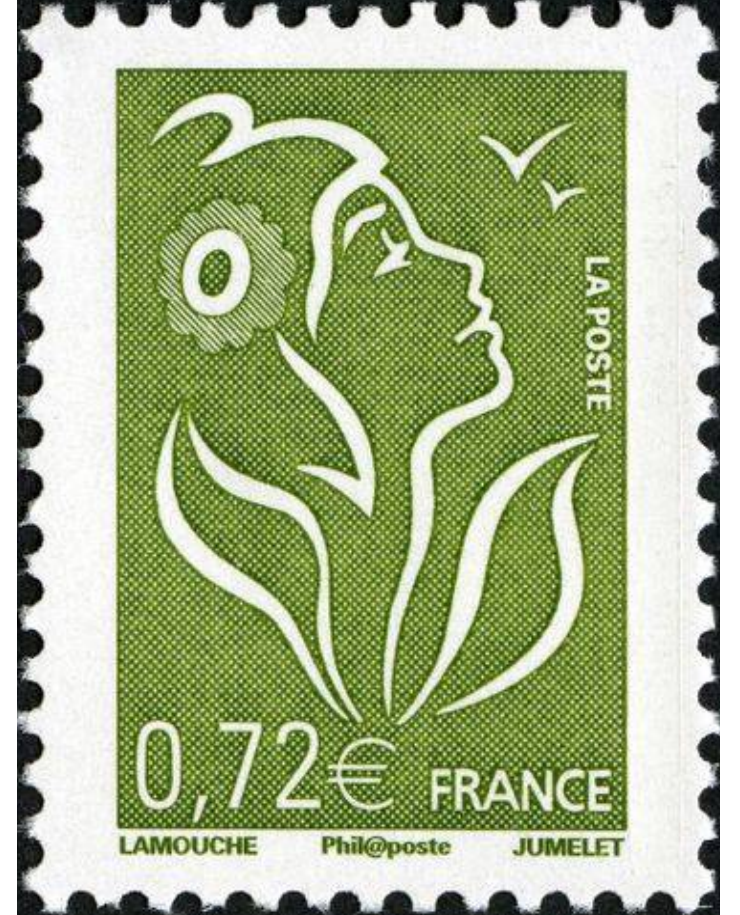
Marianne nature, 2005