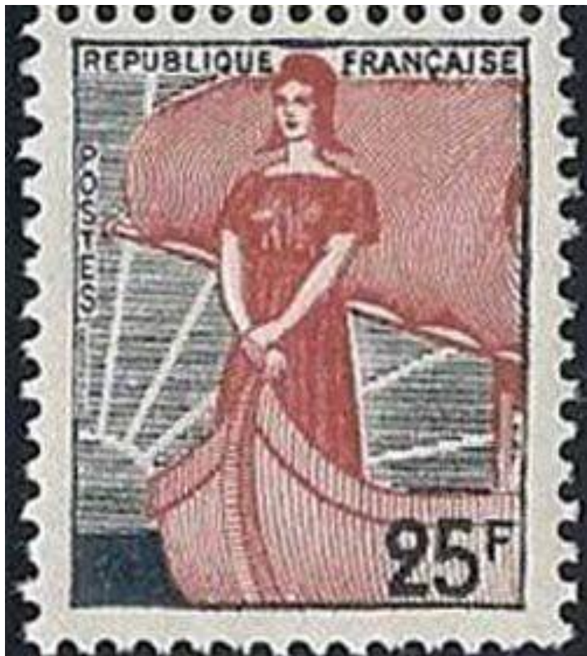
Marianne à la nef, 1959