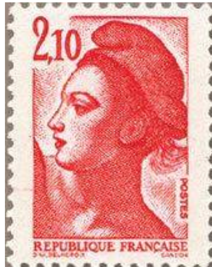
La liberté de Gandon, 1982