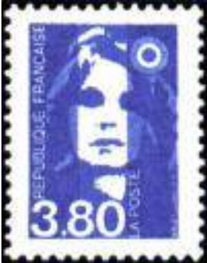
Marianne du bicentenaire, 1996