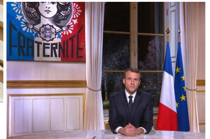
Liberté, égalité, fraternité , Shepard Fairey alias Obey, novembre 2015, 👉 Lithographie et fresque 📍 sur le mur d'un immeuble situé au 186 rue Nationale dans le XIII ème arrondissement de Paris.