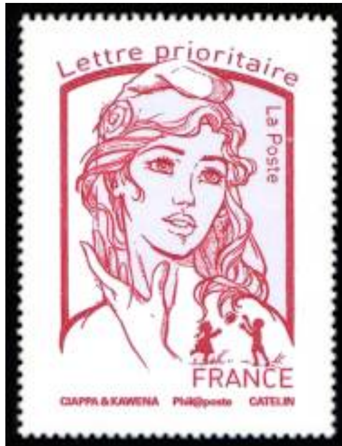
Marianne et la jeunesse, 2013