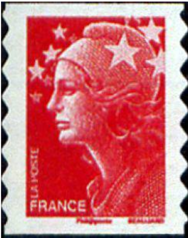
Marianne et l'Europe, 2008