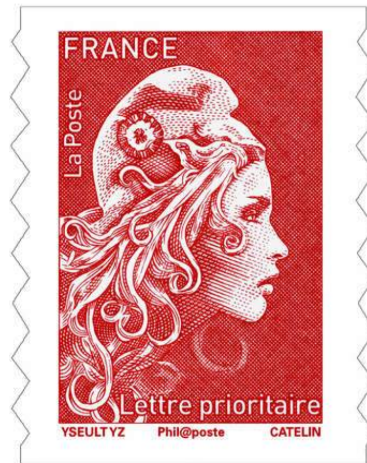
Marianne l'engagée, 2018