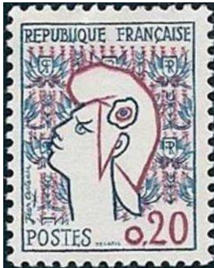
La paix, 1961