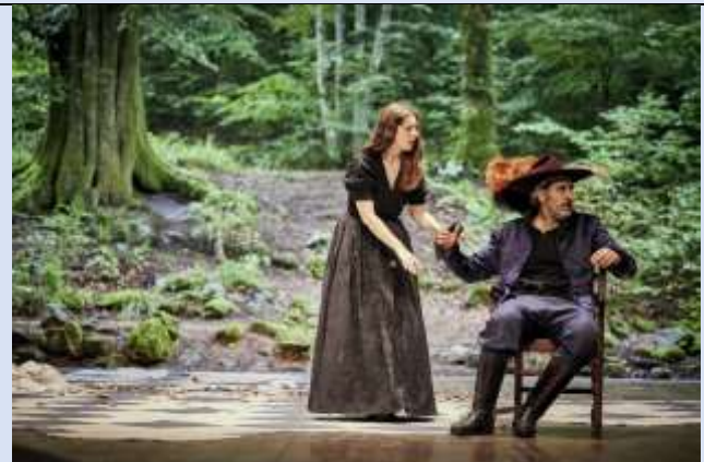
Cyrano de Bergerac au Théâtre du peuple Bussang août 2023

5 élèves lisent ensemble les adjectifs qualificatifs et 2 élèves alternent la lecture des vers. Varier le nombre d'élèves lecteurs des adjectifs ou des vers.