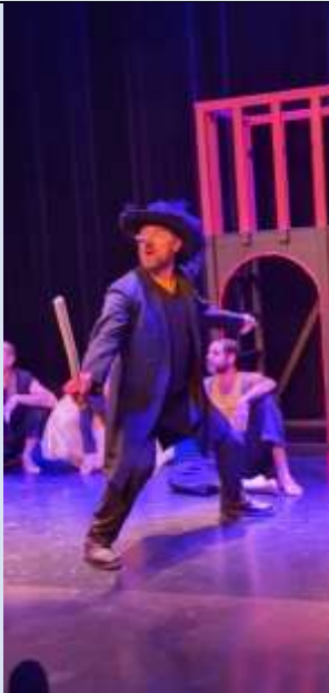
Cyrano par la Cie Mosaïque 2019