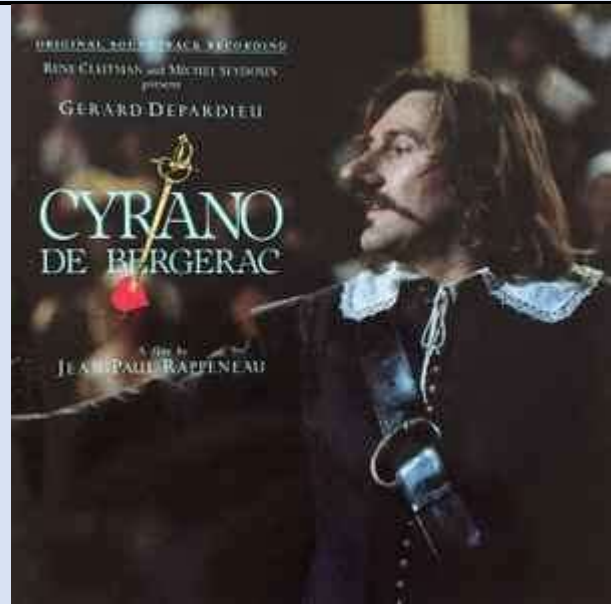
Cyrano de Bergerac au cinéma Avec Gérard Depardieu 1990