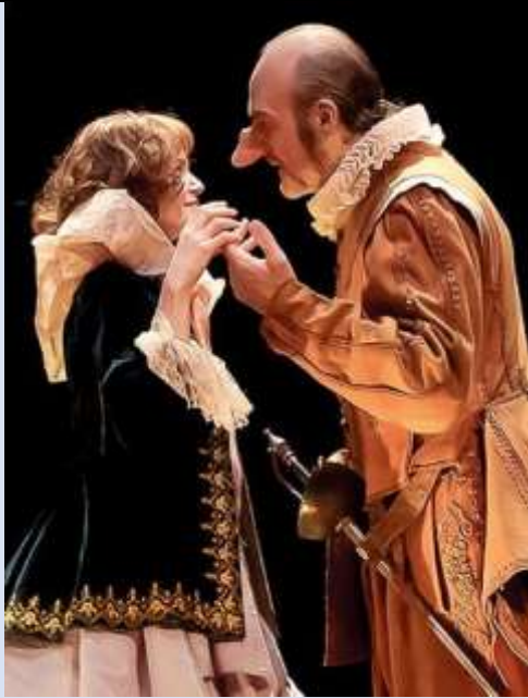
Cyrano de Bergerac par la Comédie Française avec Denis Podalydès 2007